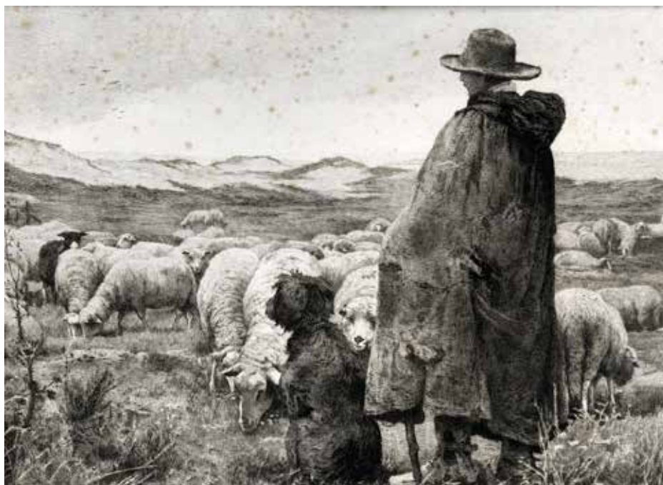
Le Berger, d'après Julien Dupré, gravé par Charles Courtry